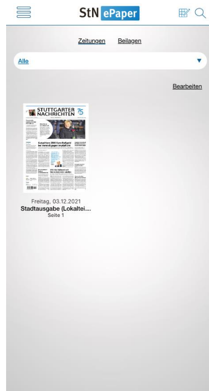
Abbildung 3 (2)